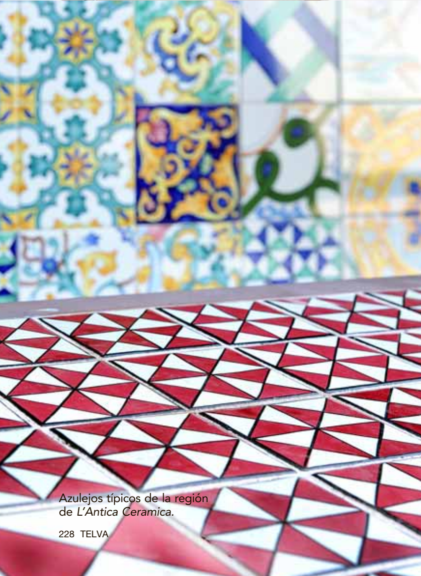
Azulejos típicos de la región de L'Antica Ceramica.