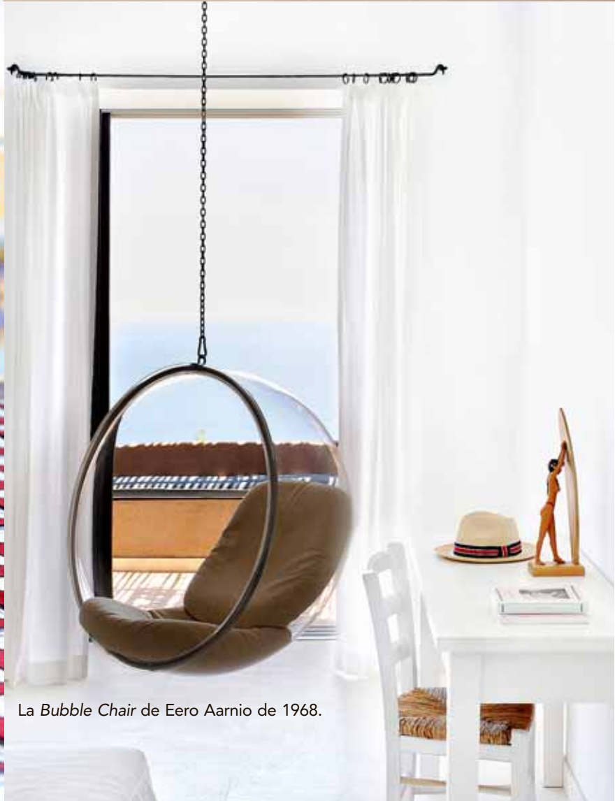
La Bubble Chair de Eero Aarnio de 1968.