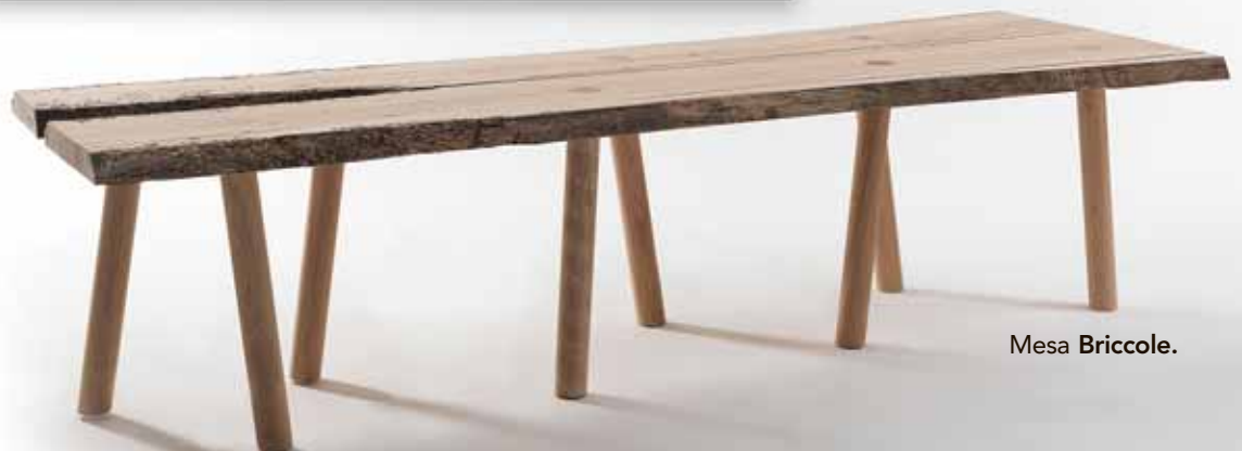
Mesa Briccole .