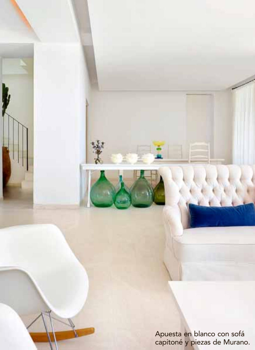
Apuesta en blanco con sofá capitoné y piezas de Murano.