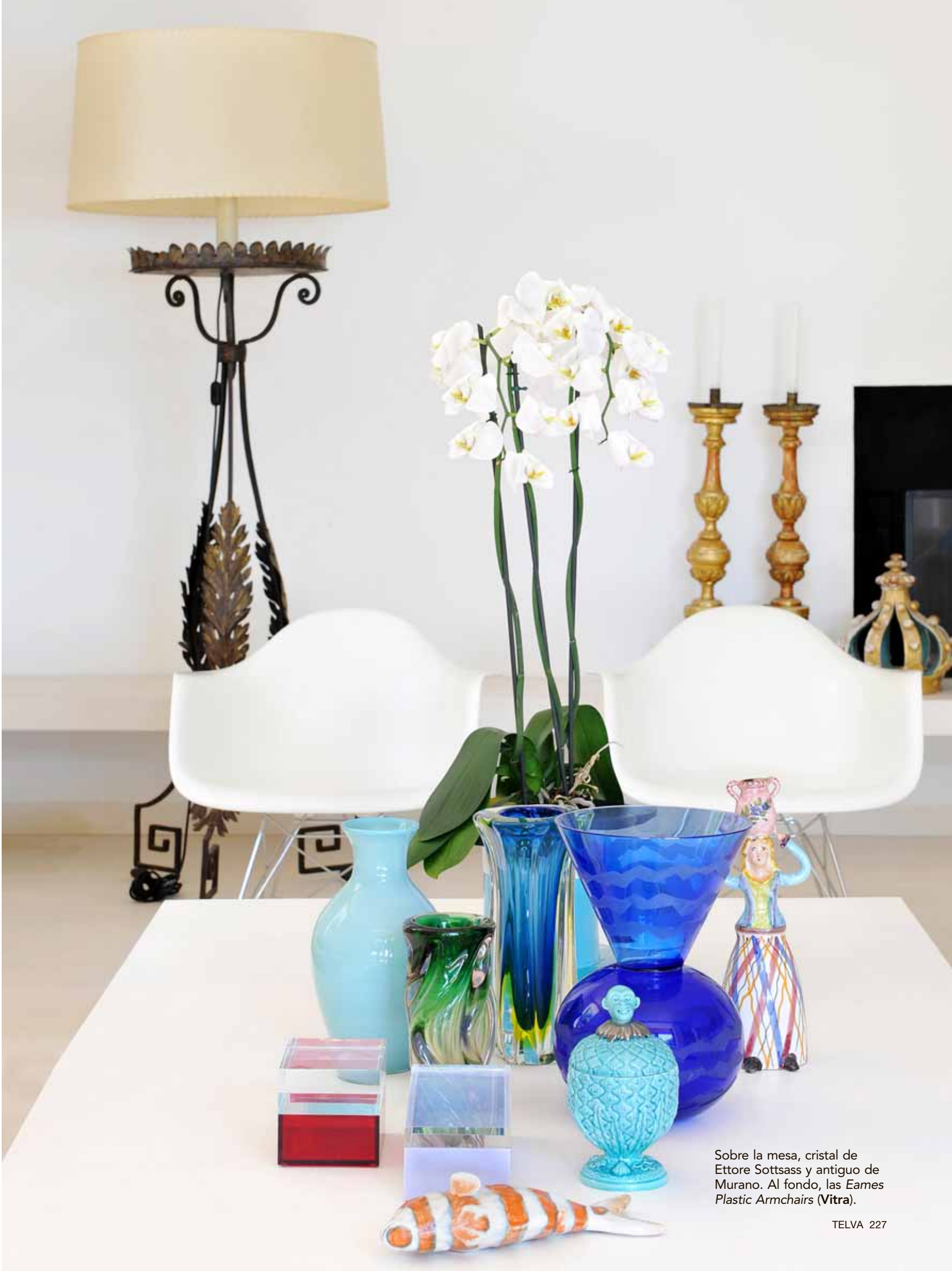
Sobre la mesa, cristal de Ettore Sottsass y antiguo de Murano. Al fondo, las Eames Plastic Armchairs (Vitra).