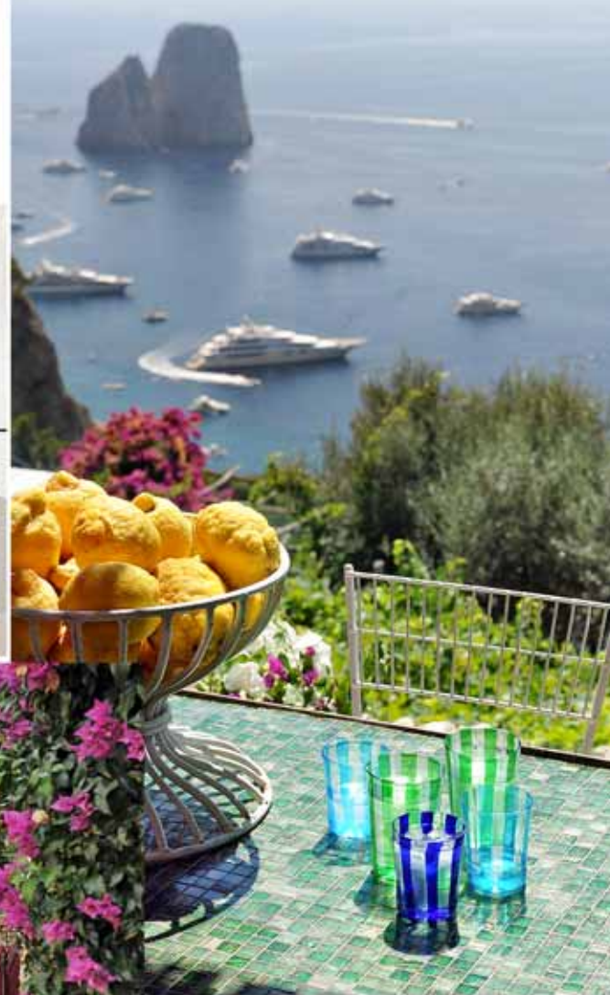
Un paseo por los rincones favoritos de Matteo.