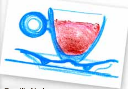
Taza Illy Nude en versión acuarela.