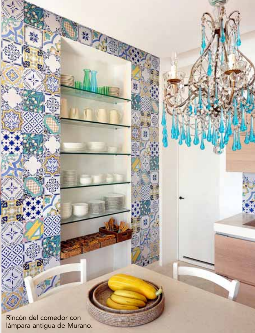
Rincón del comedor con lámpara antigua de Murano.