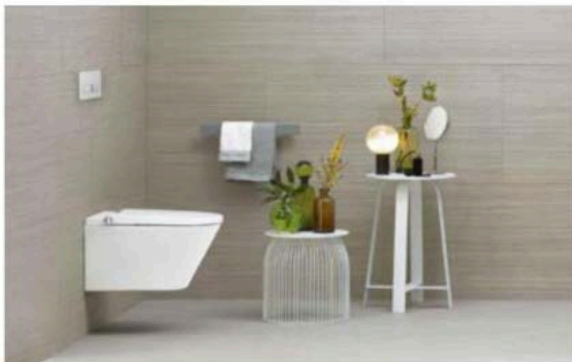
A lato, il sanitario Axent One, progettato dallo studio nel 2015

produzione firmata dallo studio, già da tempo influenzata dall'eleganza orientale e oggi allineata ai trend contemporanei. È del 2009 la vasca da bagno Ofurò disegnata per Rapsel e ispirata al bagno giapponese. In legno di larice, tagliato, formato e composto con un metodo speciale, la forma pura di Ofurò rende possibile l'immersione totale, fonte di pace e calore. Il design si concentra sull'essenziale, combina la forma con la venatura del legno e gioca con "il rapporto tra legno e acqua che proviene dall'Oriente ed è una caratteristica prevalentemente giapponese", sottolinea Rodriguez. La logica è quella dello scambio. Lo studio Thun punta da sempre a creare una trasmissione tra culture diverse e l'Asia, se parliamo di ambiente bagno, offre molte occasioni soprattutto dal punto di vista della tecnologia. "In quest'ambito Giappone, Corea e Cina sono molto più avanti di noi. Basti pensare al bidet elettronico: gli asiatici lo considerano una normalità, mentre noi abbiamo iniziato ad apprezzarlo recentemente". Nel 2015 Matteo Thun & Partners presentò Axent One, tazza con bidet incorporato realizzato per Axent C dal design equilibrato,