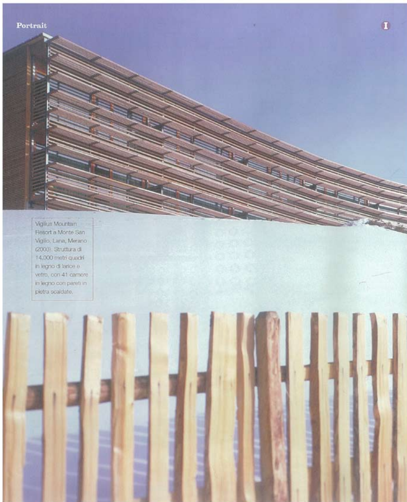
Vigilius Mountain Resort a Monte San Vigilio, Lana, Merano (2003). Struttura di 14.000 metri quadri in legno di larice e vetro, con 41 camere in legno con pareti in pietra scaldate.