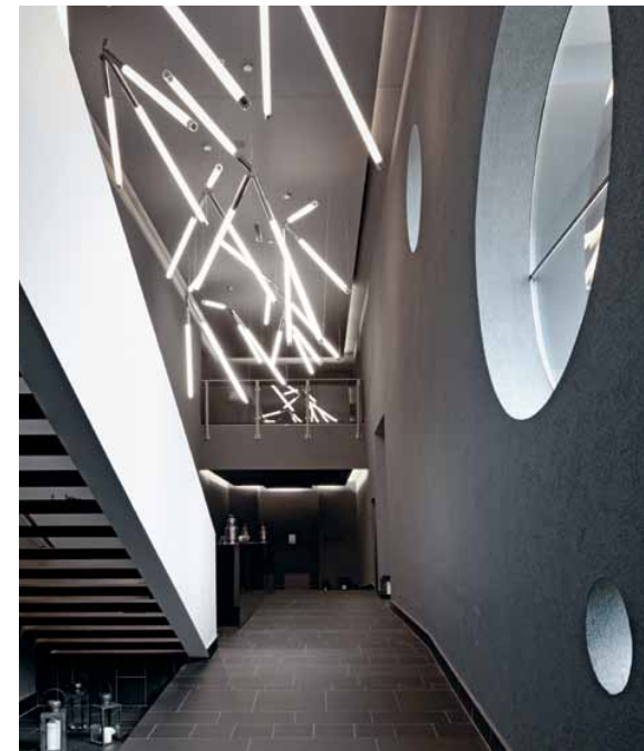
Stoelen Vigilius en San Marco voor Driade. Onder: Scorfine Linea, een lichtstelsel van Matteo Thun voor Zumtobel uit 2006. Linkerpagina: De AquaClean van Geberit werkt met een afstandsbediening, waarmee waterstraal en warmte geregeld kunnen worden.